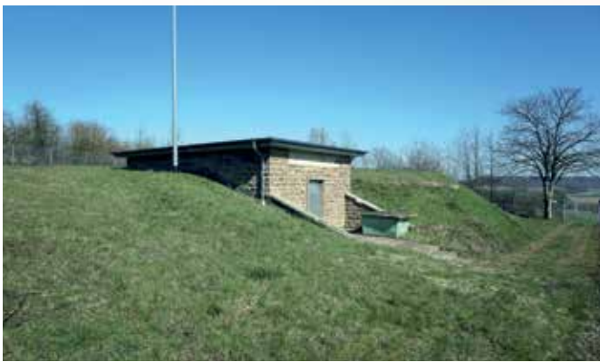
Hochbehälter Sultmer – nahe eines beliebten Spazierweges oberhalb des Galgenbergweges in Northeim. Hier wird eine von mehreren Blühwiesen der Stadtwerke Northeim entstehen.